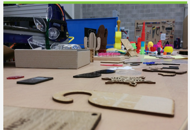
Le Fablab de Calais

SNCF Développement accompagne depuis 2011 les territoires impactés par d'importantes restructurations de sites SNCF. Au fil du temps, nous avons développé une méthode d'action qui a renforcé notre capacité à transformer, en coordination avec les acteurs locaux, le paysage économique d'un territoire. Notre démarche est toujours accueillie positivement. Ainsi à Calais, où notre engagement portait sur la création de 300 emplois, plus de 350 CDI ont déjà été signés. Un territoire sur lequel nous avons porté de beaux projets innovants, comme l'ouverture d'un centre de formation dans le domaine du numérique, l'implantation de startups, la création d'un incubateur et d'un fablab.