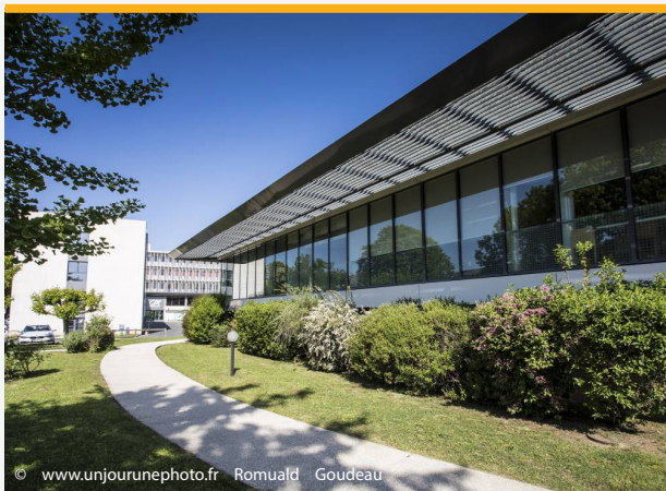
École des Nouvelles Compétences, Cité Entrepreneuriale, Saintes

Diane Le Bouvier Directrice de l'École des Nouvelles Compétences